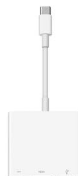
変換アダプター例